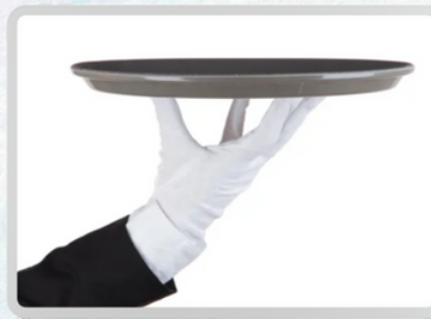
PROFESIONALES DE SERVICIO