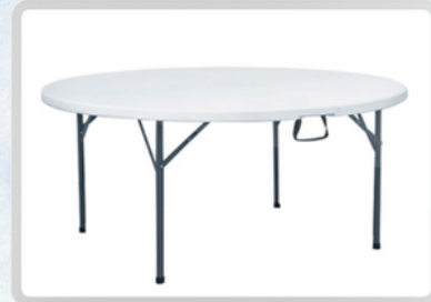
MESAS REDONDAS (10 PERSONAS)