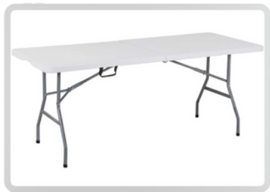
MESAS RECTANGULARES (6 PERSONAS)