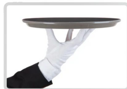
PROFESIONALES DE SERVICIO