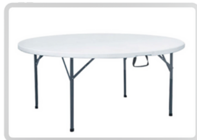
MESAS REDONDAS (10 PERSONAS)