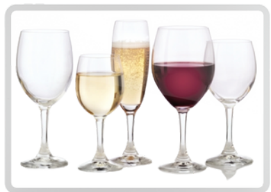
CRISTALERÍA Y MANTELERÍA